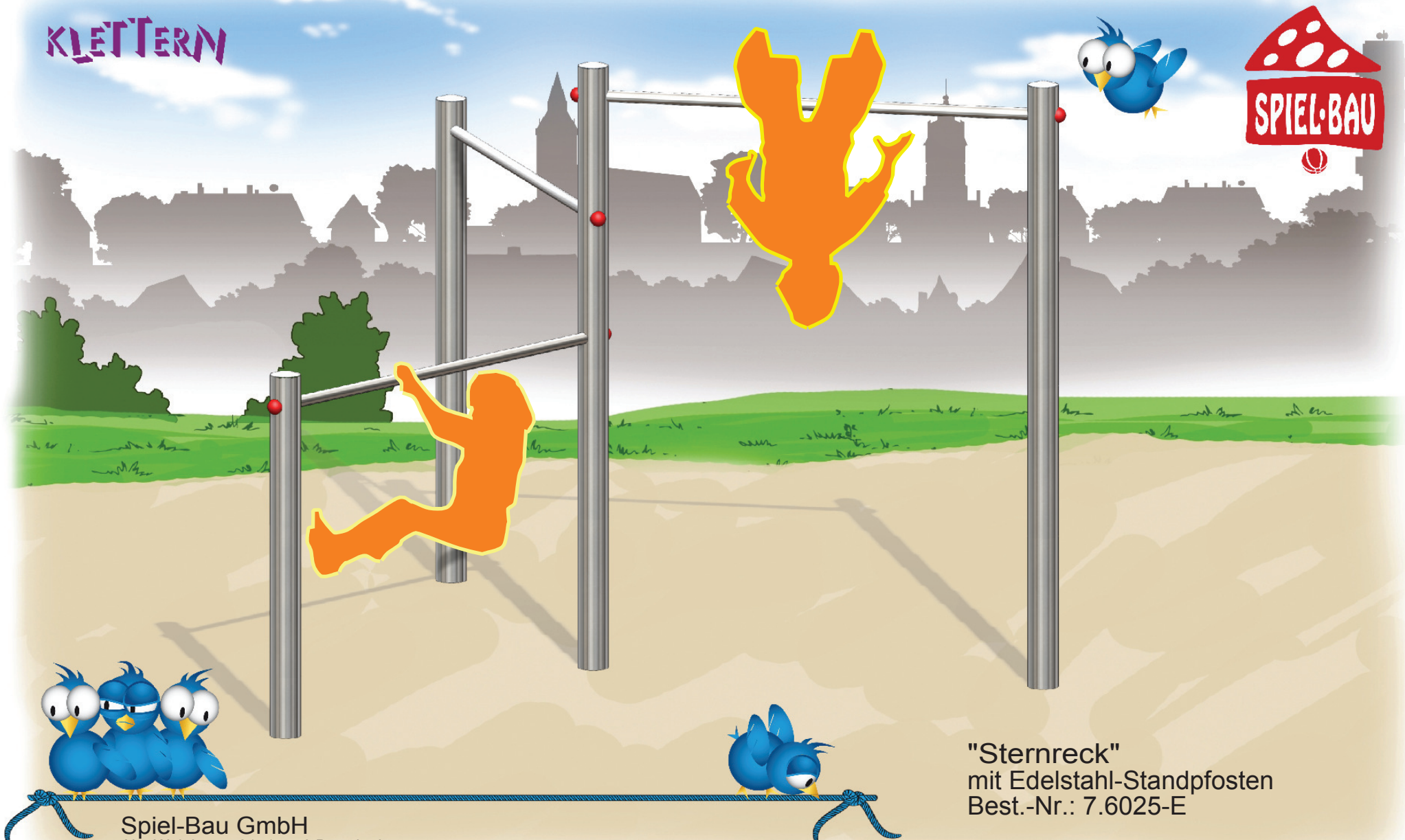
"Sternreck" mit Edelstahl-Standpfosten Best.-Nr.: 7.6025-E